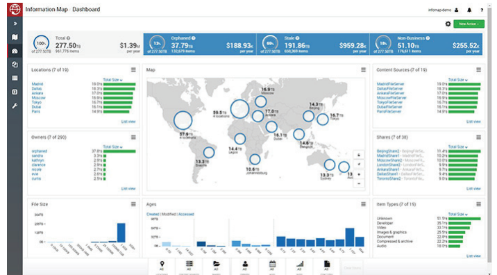
그림 4. Veritas Information Map은 정보 환경을 시각적인 컨텍스트로 제시하고 사용자가 정보를 기반으로 올바른 의사 결정을 내릴 수 있도록 도와줍니다.