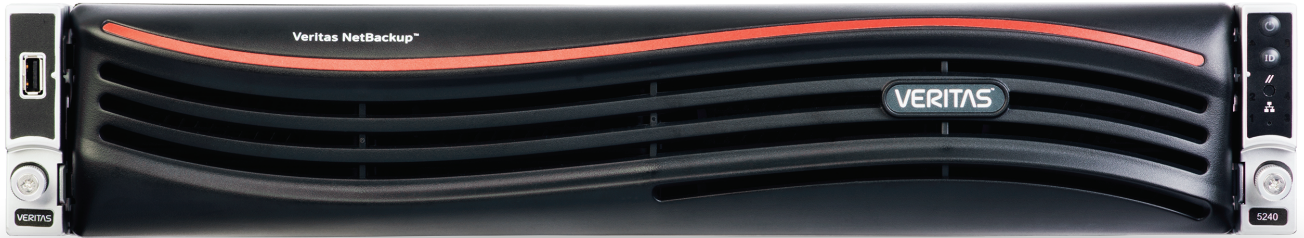
그림 2. Veritas NetBackup™ 5240은 확장 가능한 스토리지 및 지능적인 중복 제거 기능을 갖춘 통합 엔터프라이즈 백업 어플라이언스입니다.